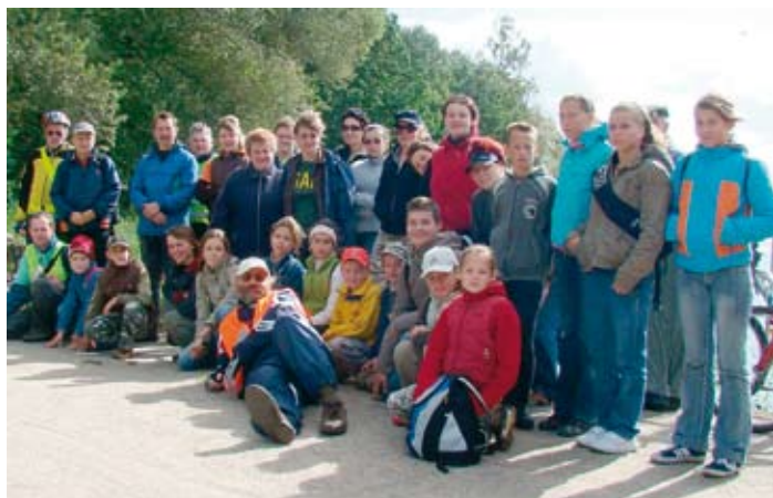
Uczestnicy rajdu rowerowego do Grzybowa.