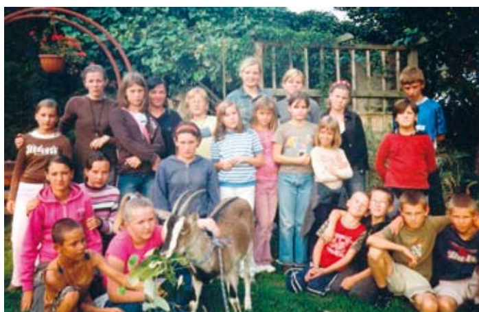
Uczestnicy kolonii w Rościnnie.