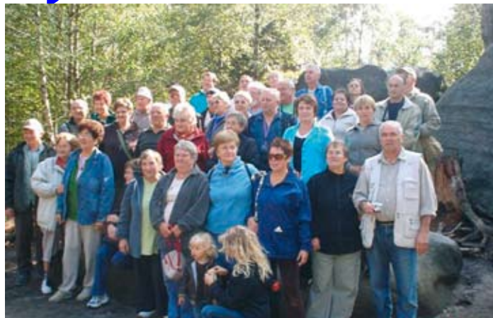
Wycieczka emerytów do Kotliny Kłodzkiej.