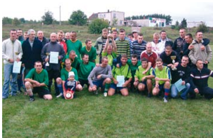
Uczestnicy Wiejskiej Ligi Piłki Nożnej 2007.