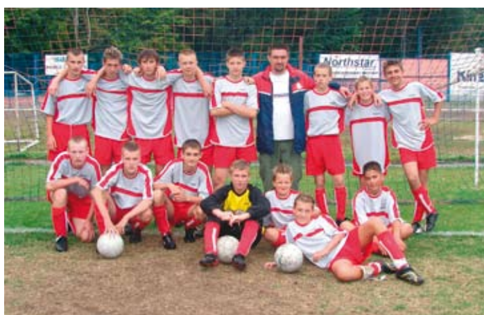
Drużyna trampkarzy starszych w sezonie 2007-2008.