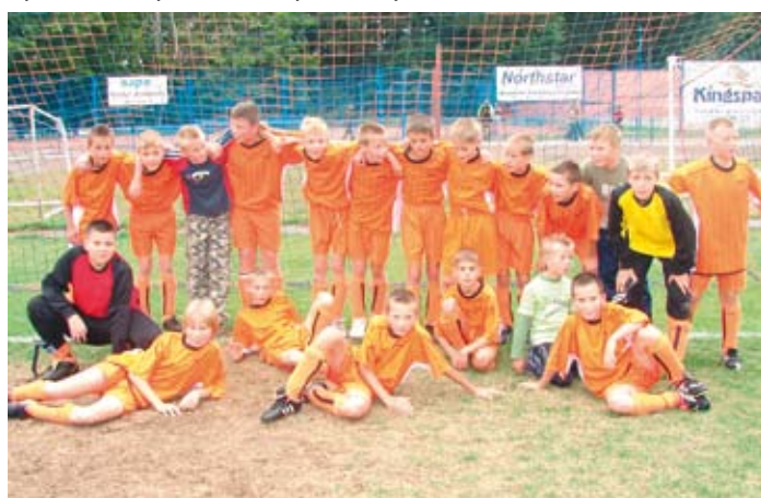
Drużyna trampkarzy młodszych w sezonie 2007-2008.