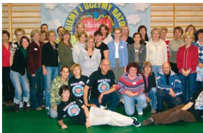
Uczestnicy i instruktorzy szkolenia Ratujemy i uczymy ratować.