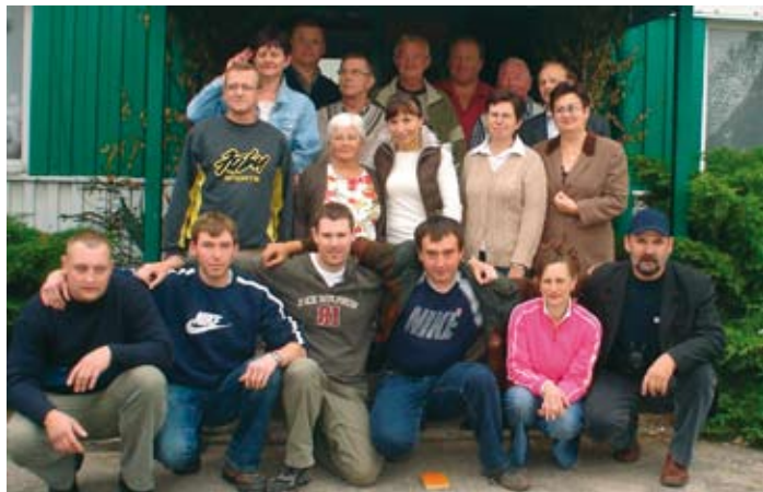
Delegacja niemieckich wędkarzy w Skokach.